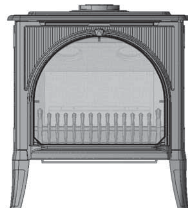
Poêle Madrona MFCS01 ou MFCS02 avec Grille de protection