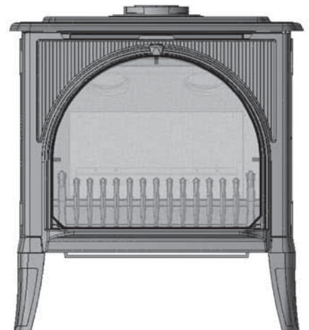
Madrona Stove MFCS01 or MFCS02 with Barrier Screen