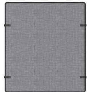
Bolero Cast Front Barrier Screen (4003289)

To clean the stove glass window, refer to the owner's manual supplied with the appliance. DO NOT clean with ammonia.