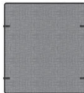
Grille de protection pour la Devanture Bolero 541BPC (4003289)

Pour nettoyer la vitre de la fenêtre, consultez le guide du consommateur fourni avec le foyer. NE PAS nettoyer la vitre avec un produit à base d'ammoniaque.