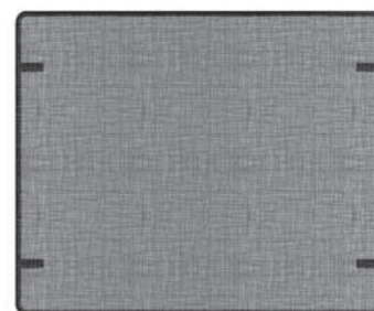
Grille de protection pour Arches de fonte (4003290)

Pour nettoyer la vitre de la fenêtre, consultez le guide du consommateur fourni avec le foyer. NE PAS nettoyer la vitre avec un produit à base d'ammoniaque.