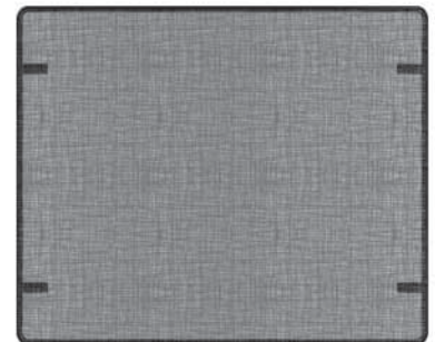
Arch Fronts Barrier Screen (4003290)

To clean the stove glass window, refer to the owner's manual supplied with the appliance. DO NOT clean with ammonia.